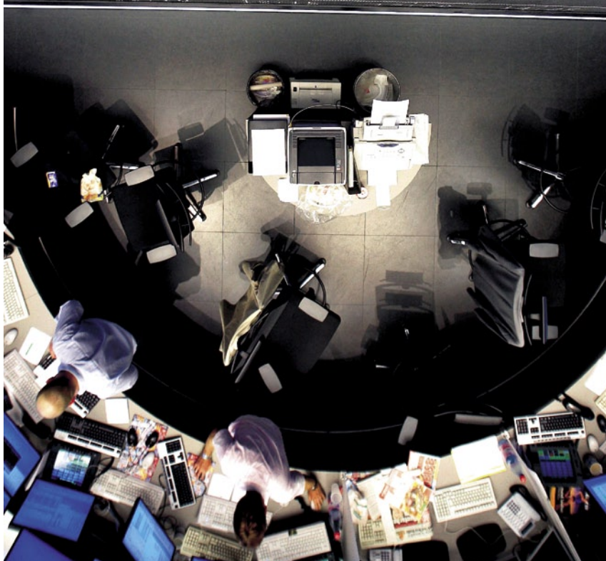
Börsenmakler in Frankfurt: lukratives Sparen mit Aktien

L angsam, aber sicher entwickeln sich Riester-Fondssparpläne zum Absatzschlager. Ende Juni zählten die Anbieter über 1,5 Millionen Fondssparer. Das bedeutet eine Vervierfachung innerhalb von zwei Jahren. Der Ansturm ist nachvollziehbar: Mit Fondssparplänen erzielen Anleger die höchsten Renditen unter allen Riester-Varianten. Das zeigt der FOCUS-MONEY-Test.